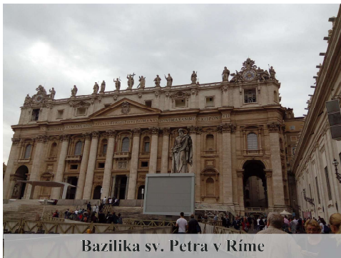
Bazilika sv. Petra v Ríme

V utorok vo večerných hodinách sme konečne dorazili do Ríma. Ubytovali sme sa v okrajovej časti Ríma, ktorá sa volá Dedinka sv. Jozefa, v kláštore Chaldejských sestier, dcér Nepoškvrnenej Panny Márie. V stredu ráno sme sa vybrali autobusom a metrom do Vatikánu na Svätopeterské námestie na generálnu audienciu. Ešte pred jej začatím okolo nás v tesnej blízkosti prešiel na papamobile svätý otec František. Po audiencii začalo poprčať, a tak sme sa po obednej prestávke, miesto prechádzky po starom Ríme, rozhodli navštíviť baziliku sv. Petra, jednu zo 4 pápežských bazilik, najväčší chrám katolíckej cirkvi. Mohli sme prejsť svätou bránou, pozrieť si Michelangelovu Pietu, uctiť si hrob sv. apoštola Petra, sv. Jána Pavla II. i mnohých ďalších pápežov, ktorí sú v bazilike pochovaní. Obdivovali sme jej krásnu výzdobu a impozantnú veľkosť. Zdatnejší pútnici vyšli po 551 schodoch pešo na vrch kupoly baziliky. Menej zdatní sa na strechu baziliky